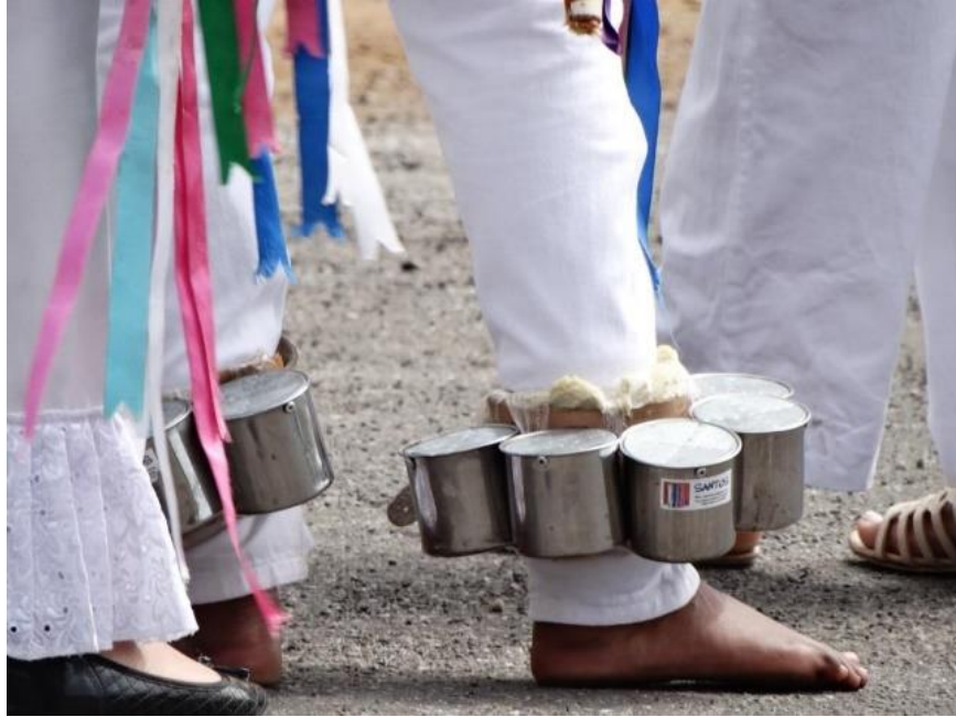
Figura 9- Gungas.

Os patangomes são instrumentos que emitem um som similar ao chocalho, podendo ser arredondados ou quadrados, com alças nas laterais para serem agitados. São feitos de metal, sendo muito comum serem usadas para isso calotas de carro, como de Kombi e fusca, que possuem formato de cuia, côncavo. No seu interior há grãos que ao se balançarem emitem seu som característico.