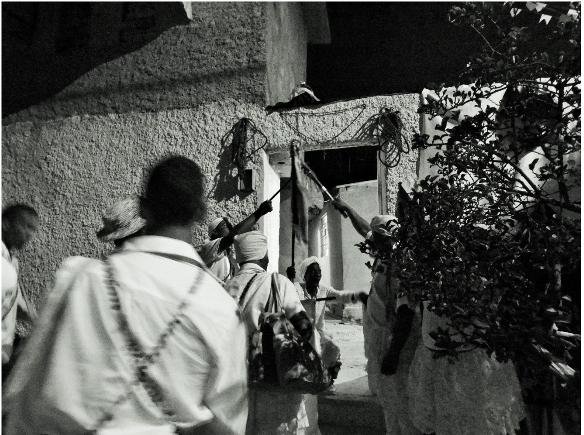
Figura 4 – Retour à la maison, mission accomplie.