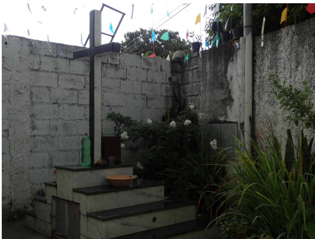
Figura 6- Cruzeiro das almas que fica na porta do centro, na casa de Sebastiana.

De frente ao centro há o vistoso cruzeiro das almas 45 e mais ao lado uma casinha de exu 46 . Ambos são parte da cosmologia da umbanda e integram os rituais. Ao lado direito do