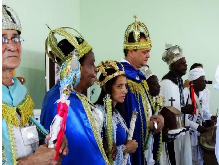
Figura 20 - Reis congos juntos na igreja.

É interessante observar que, nesse momento em que os cortes estão todos juntos, o único que canta sobre o sofrimento do negro na época do cativeiro é o da Tabatinga. Vejo esse como um grande ato político, pois a capitã canta, ressaltando suas origens negras, seus ancestrais africanos e sua religiosidade, num contexto que, embora seja festa de congado, é marcado por pessoas brancas, pela Igreja Católica, e se situa numa cidade de interior de Minas Gerais, tão conservadora que, em alguns momentos parece ainda respirar ares coloniais.