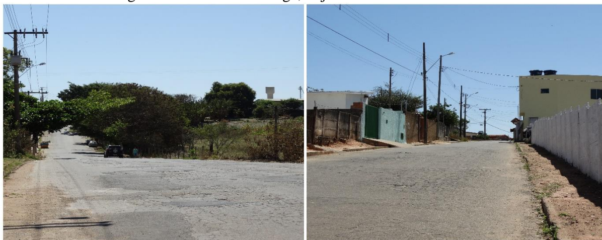
Figura 5- Ruas da Tabatinga, hoje com nome de Ana Rosa.

A comunidade Carrapatos de Tabatinga está situada no município de Bom Despacho, região centro-oeste do estado de Minas Gérias, e localiza-se a 158 km da capital mineira. Trata-se de uma cidade de porte médio, com uma população residente de aproximadamente 50 mil habitantes, sendo que desses 86% são urbanos. Segundo dados do IBGE 2017 40 , 55% da população é branca e 45% negros e pardos. Bom Despacho tem em seu comércio/serviço a parte mais produtiva das atividades econômicas.