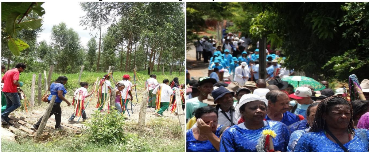
Figura 5- Festa de congado no povoado Guarita.

Converso com a guarda de vilão (um dos grupos de congado) da comunidade da Guarita, vizinha à Fagundes. Meu avô materno é nascido na Guarita e os congadeiros de lá conhecem também alguns de meus familiares. Minhas tias e tios maternos vez ou outra trabalham voluntariamente na preparação de andores de santo para determinadas festas religiosas, e uma delas é a festa de Nossa Senhora da Aparecida, realizada na Guarita todo dia 12 de outubro. No final de novembro de 2015 fechei o ano e o ciclo do Rosário com o Reinado na Guarita.