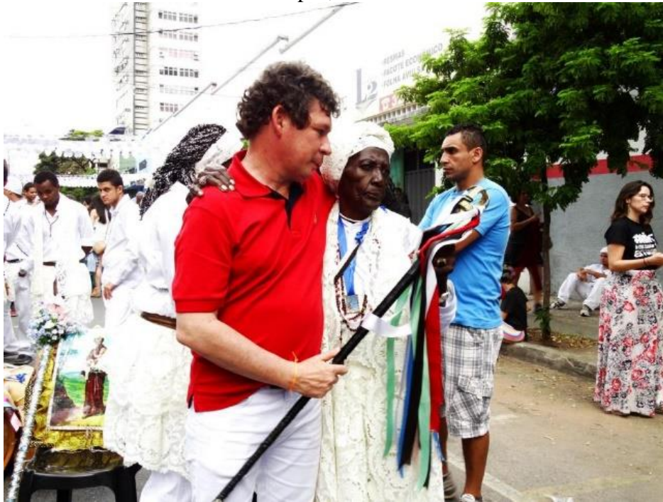
Figura 31- Tambor Mineiro. Sebastiana sendo cumprimentada pelo deputado Reginaldo Lopes, do PT.

Seu discurso carrega o peso do passado histórico que marcou o negro aqui nas Américas e que segundo ela “fez o sinhô fica rico”, às custas de muito sofrimento.