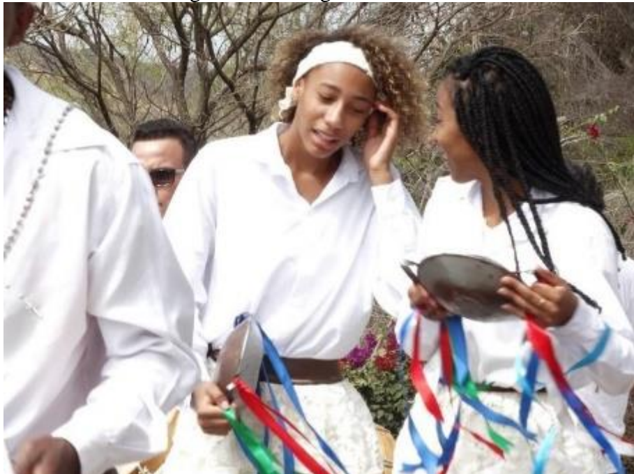
Figura 10- Patangomes em mãos.

Os patangomes são instrumentos que emitem um som similar ao chocalho, podendo ser arredondados ou quadrados, com alças nas laterais para serem agitados. São feitos de metal, sendo muito comum serem usadas para isso calotas de carro, como de Kombi e fusca, que possuem formato de cuia, côncavo. No seu interior há grãos que ao se balançarem emitem seu som característico.