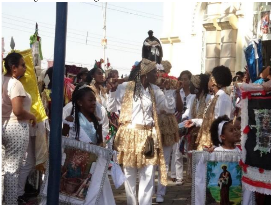
Figura 21 - Carregando o andor de São Benedito.