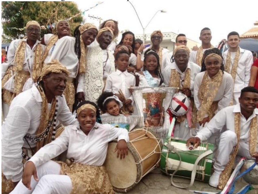
Figura 29 - Massambique São Benedito.

Leonardo: Mas aí ninguém quis pegar o bastão?