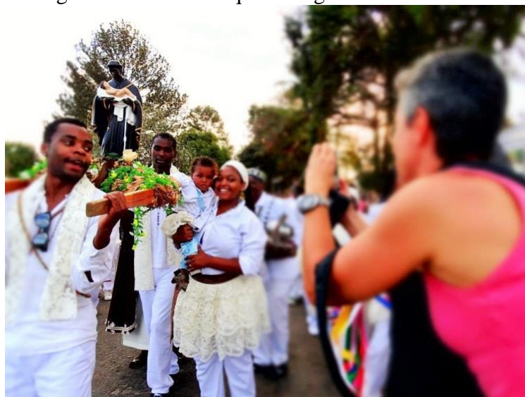
Figura 22- Massambique carregando andor.

Depois da janta, o massambique segue em direção à Tabatinga, com o andor, para depositá-lo na capela de São Benedito, na própria Tabatinga. Todo esse percurso é feito com a guarda cantando e tocando seus ritmos. Só param quando voltam todos da capela para a casa de Mãe Tiana, se reunindo no centro. Lá os instrumentos ficam guardados até o dia seguinte; os integrantes da guarda descansam um pouco, conversam, descontraem no finzinho de noite, que já marca quase a virada do dia. É um dia muito intenso, emocionante em que o corpo só sente o cansaço quando relaxa. Algumas vezes já presenciei as crianças mais novas até chorarem devido o fim da festa. Isso reforça o quão importante e bem sucedida é a transmissão oral dos saberes do rosário, marcados no entusiasmo dos pequenos.