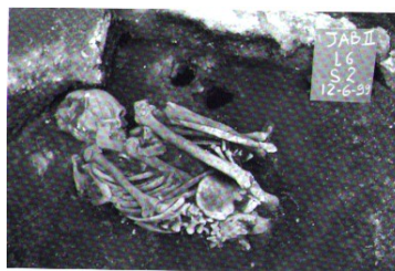
12. No sambaqui Jabuticabeira-II, SC, os mortos eram sepultados em posição fetal em pequenas covas ovaladas.