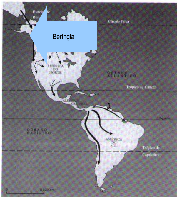
Rotas de colonização da América pelo estreito de Bering

de mulher, ao qual deu o nome de Luzia, que possui traços negróides, ou seja, traços de populações de origem africana. Além disso, muitos outros vestígios que foram encontrados em sítios arqueológicos (locais onde populações antigas deixaram) nos Estados Unidos, no Chile, no Brasil (em Lagoa Santa - MG, em São Raimundo Nonato no Piauí, etc), apresentam datações bem mais antigas que 12 mil anos.